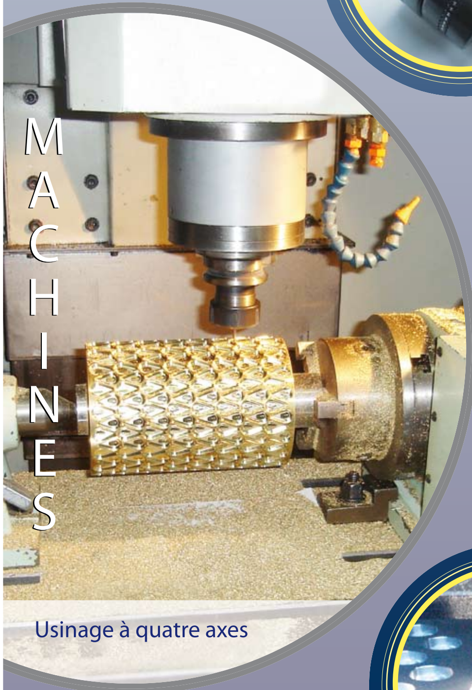
Usinage à quatre axes