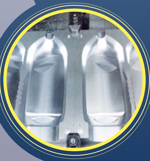
Moules de soufflage

La société SIAF a signé un accord de coopération avec la société d'origine Taïwanaise AKIRA - SEIKI pour commercialiser tout type de machines de précision à commande numérique (Precision CNC Machine Tools).